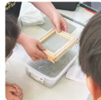
パルプの繊維が崩れないよう、ゆっくり枠からはずします