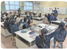
紙リサイクルが「できる」「できない」の〇×クイズでは、教室のあちこちから歓声があがるほどの盛り上がり（上/春木台小学校、左・下/万場小学校）